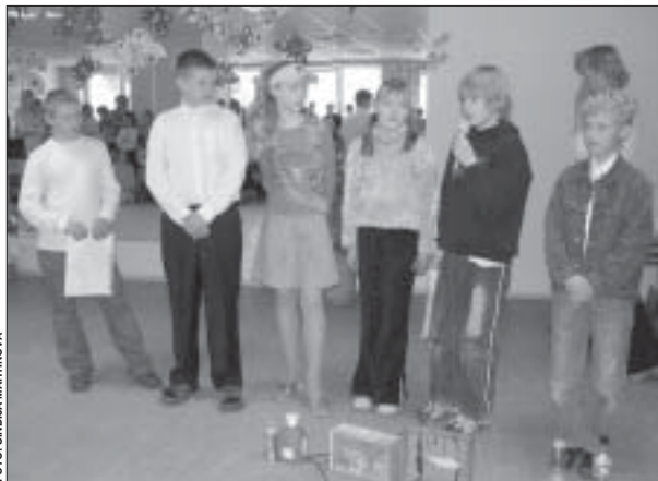
4.a klases skolēni stāsta par atkritumu šķirošanu un pārstrādi.

4.a klase izstrādāja projektu par atkritumu pārstrādi. Šie bērni pabija arī Getliņu izgāztuvē, kur uz zināja par jaunākajām tehnoloģijām atkritumu pārstrādē un uzglabāšanā. Izrādās, lielajā izgāztuvē tiek organizētas arī ekskursijas gida pavadībā. Skolēni aptaujāja arī vietējos iedzīvotājus par Garkalnes pagasta atkritumu saimniecību, un izrādās, ka šis ir pagasta vājais punkts – cilvēki ir neapmierināti, ka atkritumus izved tik reti, līdz ar to ir lielais risks, ka dražas tiks izvazētas vai