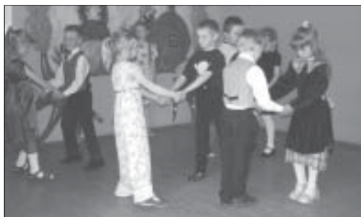
"Skudriņu" iemītnieki izpilda salsas pamatsoli.