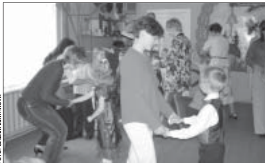
Māmiņas kopā ar bērniem dejo lēnā valša četrstūrī.

strādā, bet fakts ir viens: jau šobrīd izkristalizējies bērnu talants, un viens otrs dienās noteikti varētu kļūt par labu dejojāju, čuk-