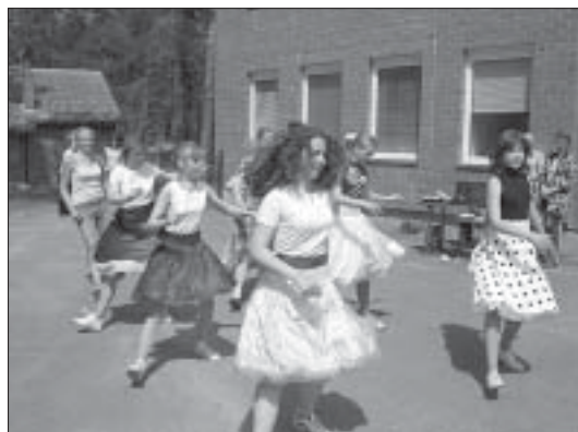
Pēc nogurdinošās sporta dienas dalībnieki vēro līnijaizvērtāju jautro un interesanto priekšnesumu, kurā varēja iesaistīties ikviens interesents.