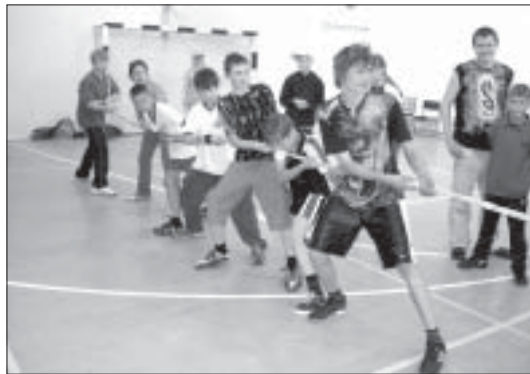
Vīrves vilkšanas sacensībās visaktīvākie bija līdzjutēju kļiedzieni: "Reizē... reizē..."