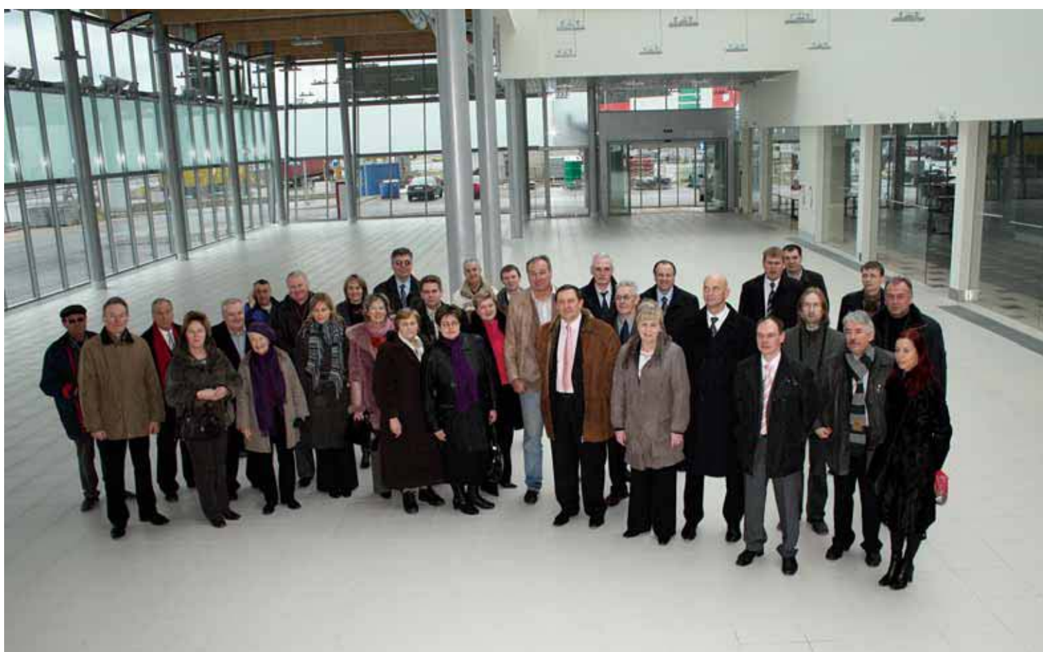
Atklāšanas svētku viesi