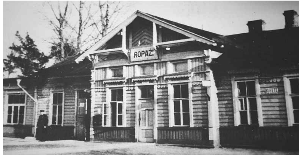
Vecā Ropažu stacija

Ropažu sūkņu stacija, bija iemesls, kamdēļ no Garkalnes organizēja 1949. gada izvešanu. No Ropažu stacijas uz Krievijas ziemeļiem izveda divus preču vagonu sastāvus. Eduarda kungs atceras, kā tas ir noticis: "Pamazām vien, pa vienai mašīnai veda jaunus un jaunus nelaimīgos, toreiz dzelzceļa darbiniekiem bija stingri aizliegts fotografēt vai darīt jebkādas citas darbības, kas varētu kaitēt deportācijas norisei. Pirms izvešanas Sibīrijai nolemtie bruņotu vīru pavadībā gāja pēc ūdens". Bez tiesas sprieduma un paskaidrojumiem uz Sibīriju izsūtīja bērnus un sirmgalvjus,