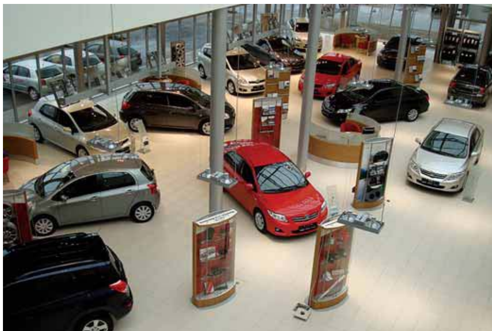
Jaunie auto Toyota salonā