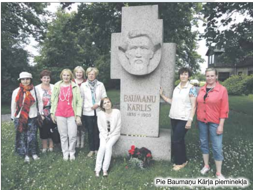
Pie Baumaņu Kārļa pieminekļa

Šā gada 9. jūlijā Garkalnes dāmu klubs „Pīlādītis” devās savā ikgadējā braucienā pa Latviju, lai apskatītu Vidzemes rietumdaļu, bijušās lībiešu apdzīvotās teritorijas un tās vietas, kuras kādreiz ir jutušas arī rakstnieka Jāņa Jaunsudrabiņa pēdu pieskārienus.