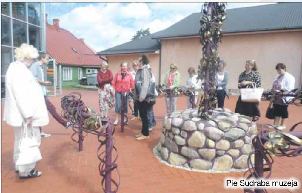
Pie Sudraba muzeja