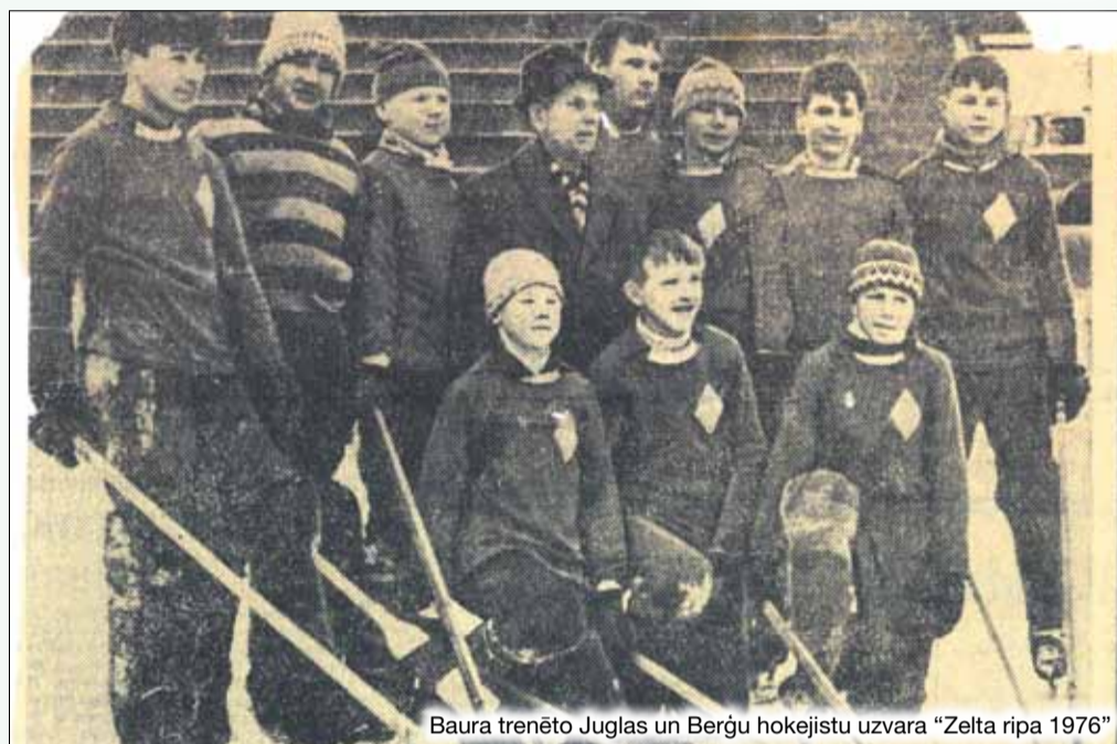
Baura trenēto Juglas un Berģu hokejistu uzvara "Zelta ripa 1976"