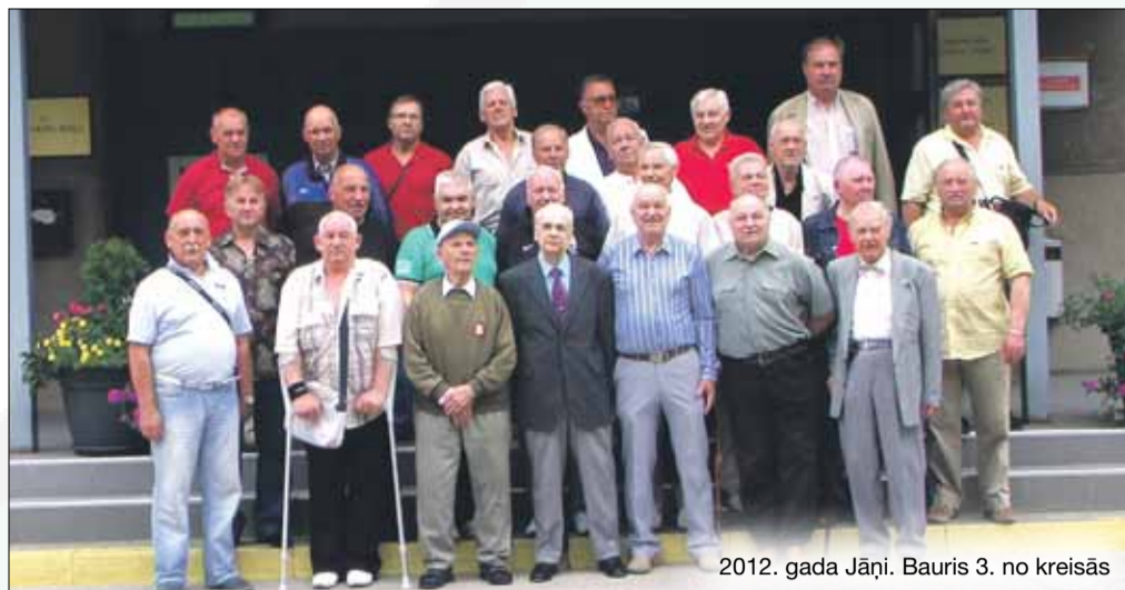
2012. gada Jāni. Bauris 3. no kreisās