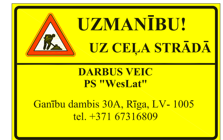
Brīdinājuma plakāts (2.0 x 1.5 m)